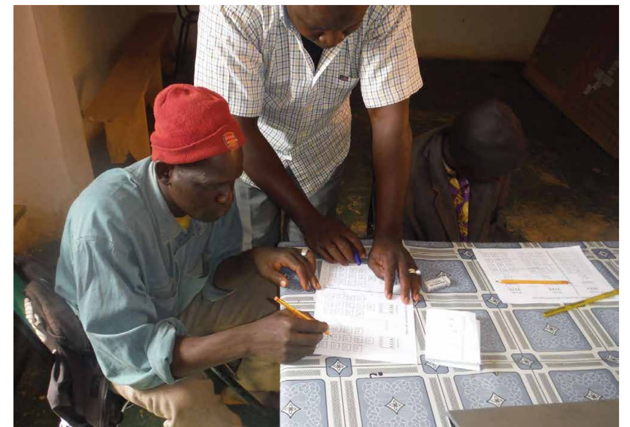
Photos (de gauche à droite, de haut en bas) : 1 - Co-construction des outils de formation avec les maçons-formateurs et le Pôle Formation d'AVN 2 - Formation technique in situ 3 - Atelier de formation entrepreneuriale